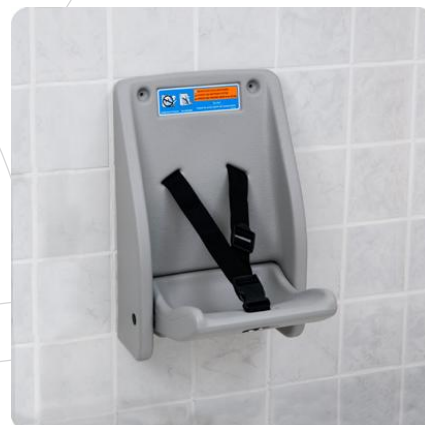
En kraftig sikkerhedssele holder barnet godt fastspændt.